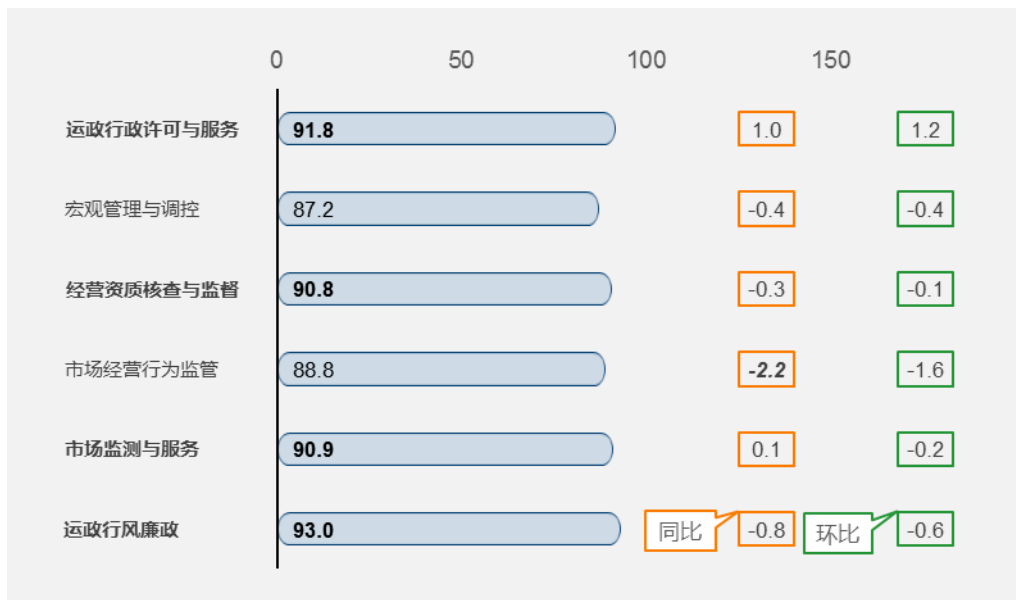
图3 运输市场管理指标综合满意度同环比图

“宏观管理与调控”87.2分，良好等级；“市场经营行为监管”88.8分，良好等级；其它4个二级指标为优秀等级。“市场经营行为监管”同比下降2.2分，下降明显。“市场经营行为监管”环比下降1.6分。