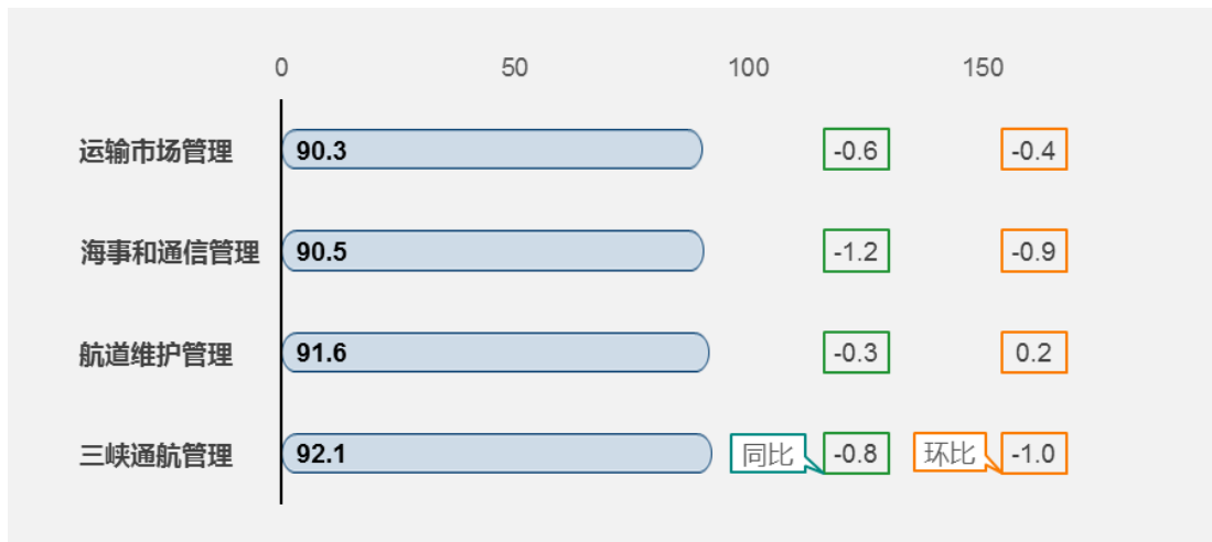
图2 一级指标满意度同环比图