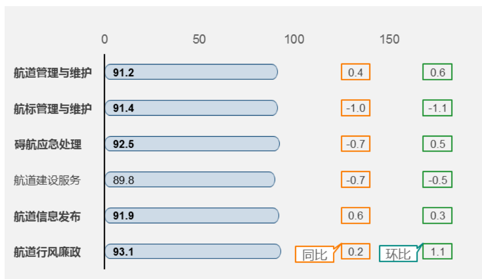
图 5 航道维护管理二级指标满意度同环比图