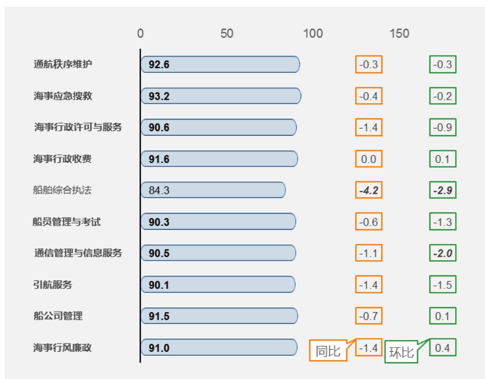
图 4 海事监督和通信管理二级指标满意度同环比图

法”环比下降 2.9 分，下降明显；“通信管理与信息服务”环比下降 2.0 分，下降明显。