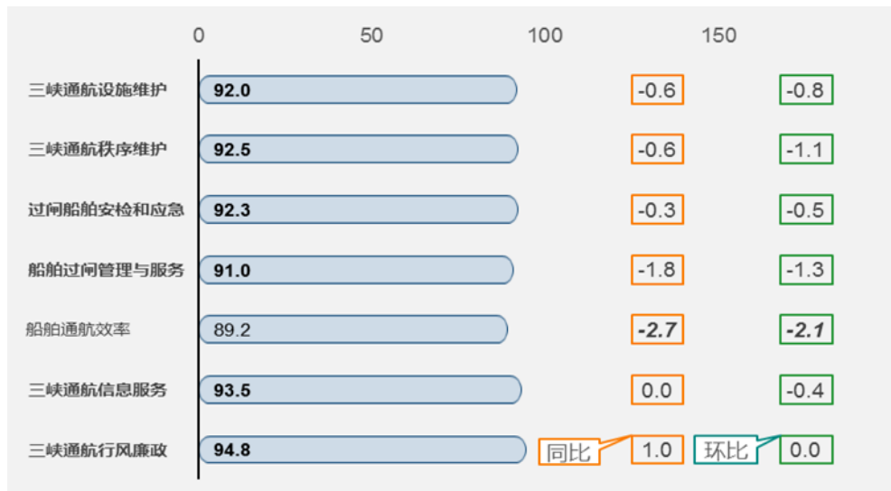
图 6 三峡通航管理二级指标满意度同环比图

“船舶通航效率” 89.2 分，良好等级；其它 6 个二级指标均为优秀等级。“船舶通航效率”同比下降 2.7 分，下降明显；“船舶过闸管理与服务”同比下降 1.8 分。“船舶通航效率”环比下降 2.1 分，下降明显。